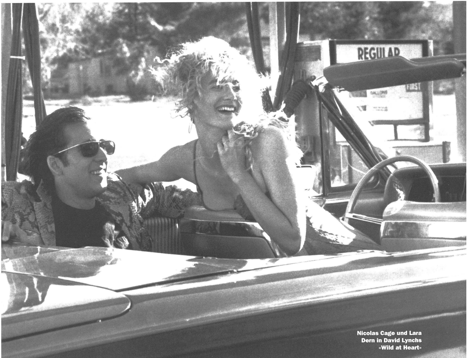
Nicolas Cage und Lara Dern in David Lynchs «Wild at Heart»