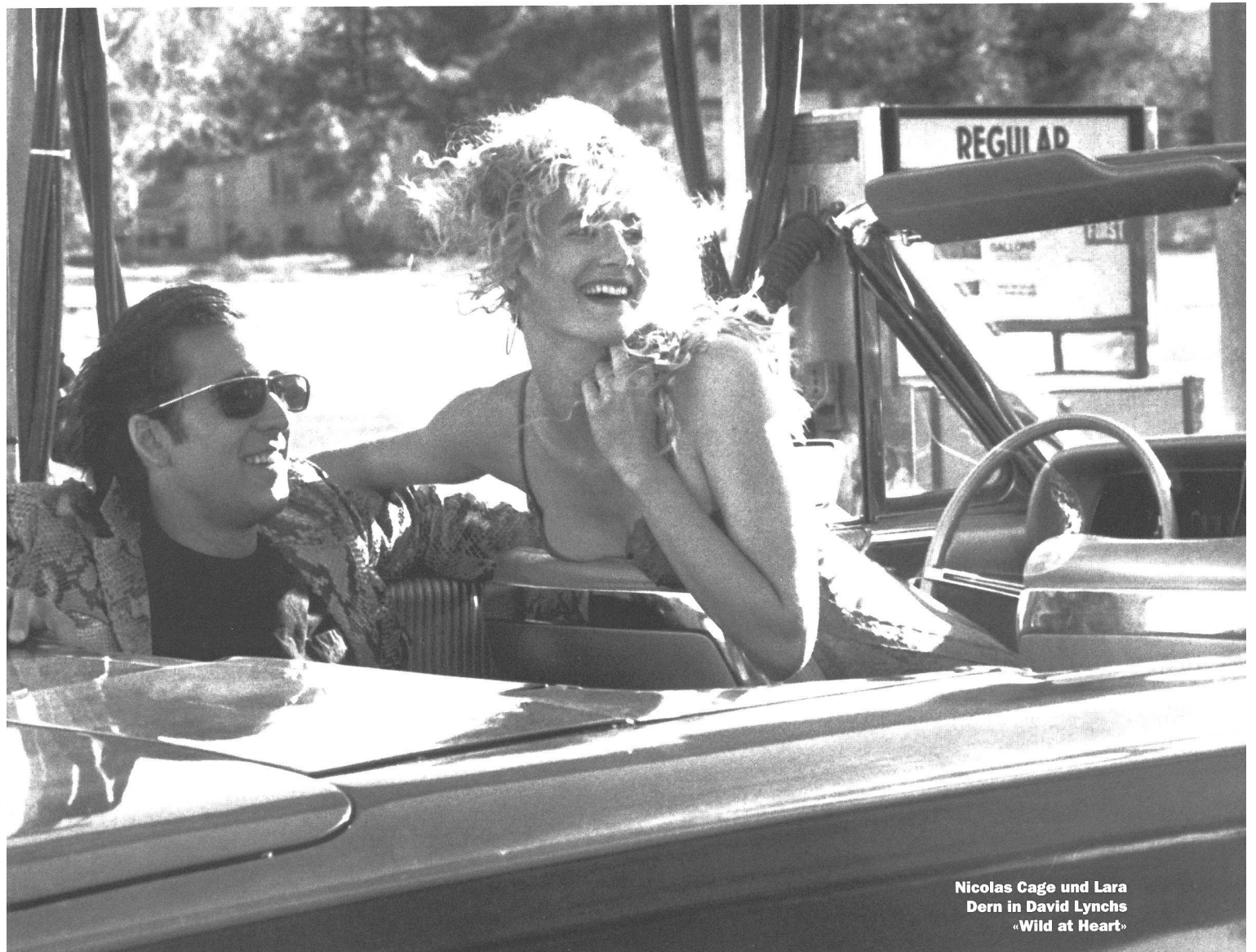
Nicolas Cage und Lara Dern in David Lynchs «Wild at Heart»