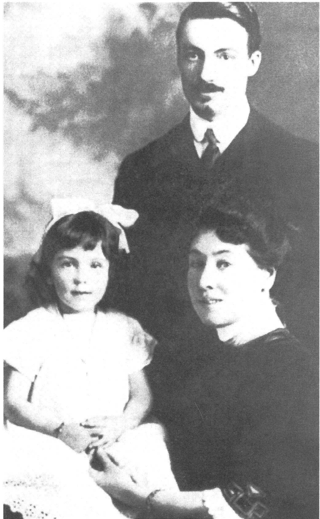
Die erste Regisseurin überhaupt. Alice Guy, hier mit Ehemann und Tochter

Lois Weber (1882 - 1939) begann 1913 Filme zu realisieren und war äusserst produktiv. Sie zeichnete gleichzeitig für Buch, Regie, Darstellung und Produktion – nicht in kleinen, handgestrickten Filmen, sondern in ausgewachsenen Major-Produktionen. In den zehner Jahren, als vieles noch sehr