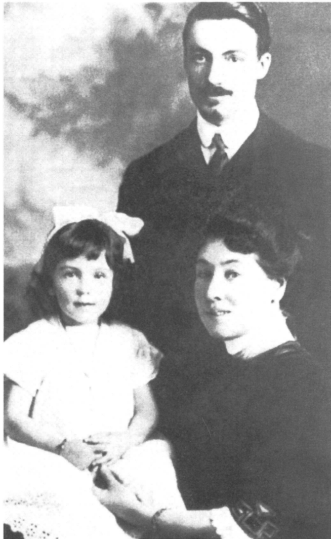
Die erste Regisseurin überhaupt, Alice Guy, hier mit Ehemann und Tochter

Lois Weber (1882 - 1939) begann 1913 Filme zu realisieren und war äusserst produktiv. Sie zeichnete gleichzeitig für Buch, Regie, Darstellung und Produktion – nicht in kleinen, handgestrickten Filmen, sondern in ausgewachsenen Major-Produktionen. In den zehner Jahren, als vieles noch sehr