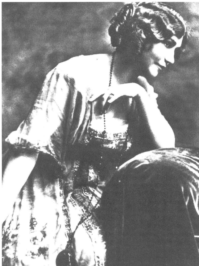
Brachte brisante Themen auf die Leinwand: Lois Weber

Die Produktionskosten waren damals noch verhältnismässig tief, die Löhne im Allgemeinen niedrig und es war üblich, zwischen Schauspielerei, Schreiben und Regie hin und her zu pendeln, oft in der gleichen Produktion. Ab anfangs der zwanziger Jahre schnellten die Kosten immer höher, das Star-System gewann Strukturen, Arbeitsteilung und zentrale Managements machten die Realisierung eines Films schwieriger. Die Frauen waren je länger je weniger gern gesehen (es sei denn auf der Leinwand), als Mitglieder in den Gewerkschaften waren sie nicht erwünscht. Lois Weber hat bis 1939 Filme realisiert, allerdings mit schwindendem Erfolg. Später war sie Script-Supervisor und führte Screenings mit Jungstars durch. Die Regie-Königin der zehner und zwanziger Jahre, die zwischen