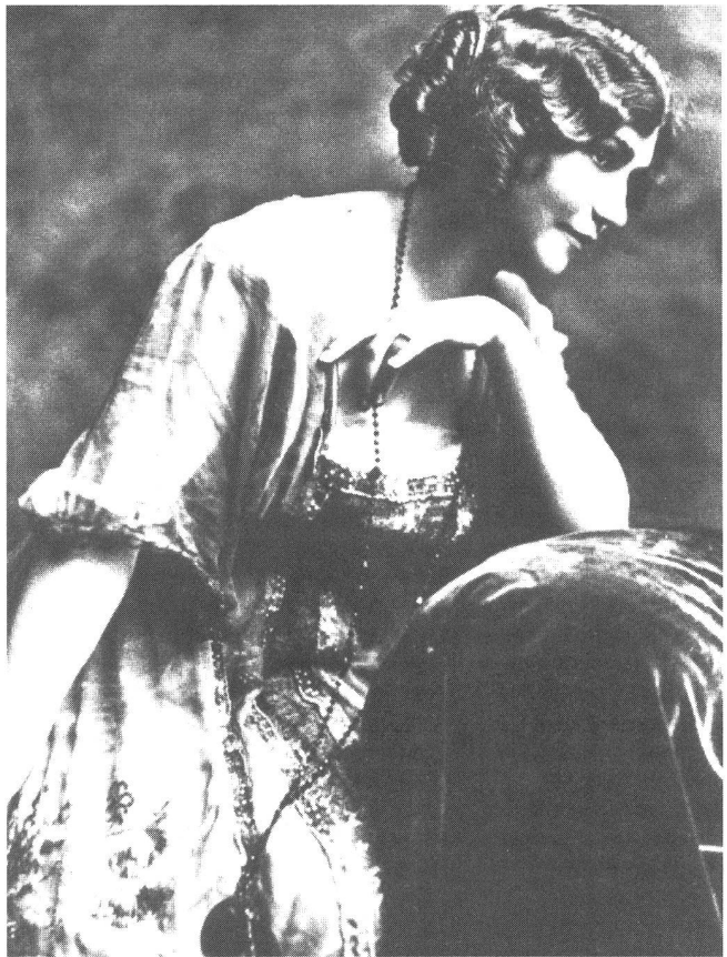
Brachte brisante Themen auf die Leinwand: Lois Weber

Die Produktionskosten waren damals noch verhältnismässig tief, die Löhne im Allgemeinen niedrig und es war üblich, zwischen Schauspielerei, Schreiben und Regie hin und her zu pendeln, oft in der gleichen Produktion. Ab anfangs der zwanziger Jahre schnellten die Kosten immer höher, das Star-System gewann Strukturen, Arbeitsteilung und zentrale Managements machten die Realisierung eines Films schwieriger. Die Frauen waren je länger je weniger gern gesehen (es sei denn auf der Leinwand), als Mitglieder in den Gewerkschaften waren sie nicht erwünscht. Lois Weber hat bis 1939 Filme realisiert, allerdings mit schwindendem Erfolg. Später war sie Script-Supervisor und führte Screenings mit Jungstars durch. Die Regie-Königin der zehner und zwanziger Jahre, die zwischen