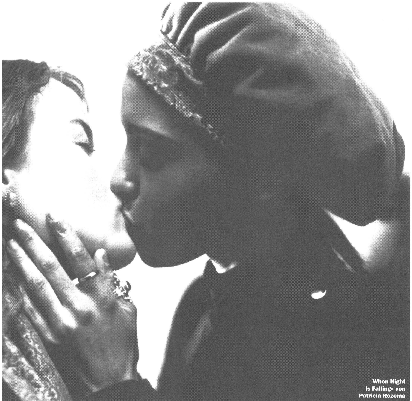
«When Night Is Falling» von Patricia Rozema