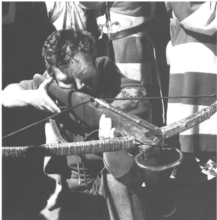
«Wilhelm Tell - Burgen in Flammen» (1960) von Michel Dickoff