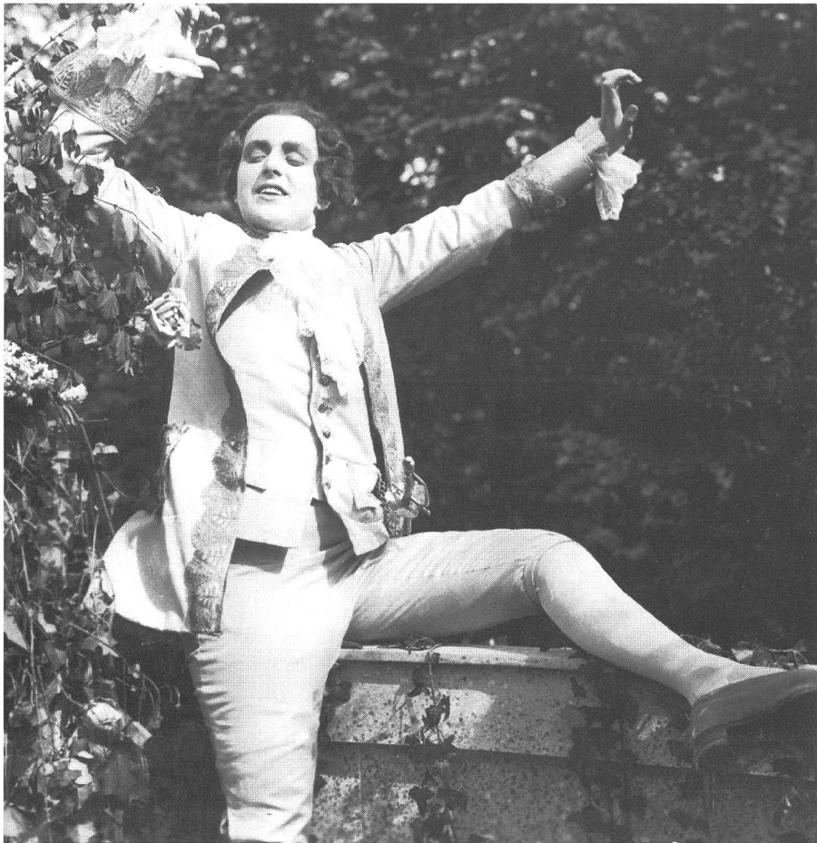
«Figaros Hochzeit» (1920) von Max Mack

Der Film ist in den 100 Jahren seines Bestehens zu einem wichtigen Teil der kollektiven Erinnerung