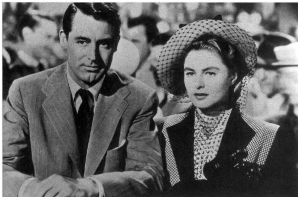
Eingekleidet von Edith Head, der First Lady des Kostümdesigns: Cary Grant und Ingrid Bergman in «Notorious» (Alfred Hitchcock, 1948)

Heutzutage leisten sich die Produktionsgesellschaften kaum noch eigene Stardesignerinnen und -designer exklusiv. Aber die Synergien zwischen dem Jahrmarkt der Illusionen und dem der fashionablen Eitelkeiten werden ohnehin immer mehr ausgereizt. Zuweilen fällt die Lancierung eines Films gar mit der Präsentation eines Modetrends zusammen. Der eingangs erwähnte Ralph Lauren, ein gewiefter Unternehmer, hat seine Kreationen für Jack Claytons «The Great Gatsby» (USA 1974) oder für Woody Allens «Annie Hall» (USA 1977) seinerzeit parallel zum Filmstart in den Boutiquen von Beverly Hills angepriesen.