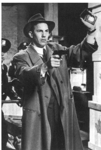
Eleganz italienischer Provenienz: Kevin Costner in Armani («The Untouchables», Brian De Palma, 1986)