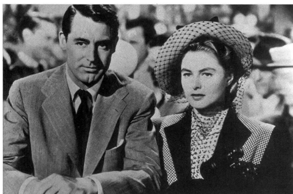
Eingekleidet von Edith Head, der First Lady des Kostümdesigns: Cary Grant und Ingrid Bergman in «Notorious» (Alfred Hitchcock, 1948)

Heutzutage leisten sich die Produktionsgesellschaften kaum noch eigene Stardesignerinnen und -designer exklusiv. Aber die Synergien zwischen dem Jahrmarkt der Illusionen und dem der fashionablen Eitelkeiten werden ohnehin immer mehr ausgereizt. Zuweilen fällt die Lancierung eines Films gar mit der Präsentation eines Modetrends zusammen. Der eingangs erwähnte Ralph Lauren, ein gewiefter Unternehmer, hat seine Kreationen für Jack Claytons «The Great Gatsby» (USA 1974) oder für Woody Allens «Annie Hall» (USA 1977) seinerzeit parallel zum Filmstart in den Boutiquen von Beverly Hills angepriesen.