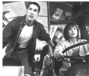
Prinzip Tempo: «Speed»