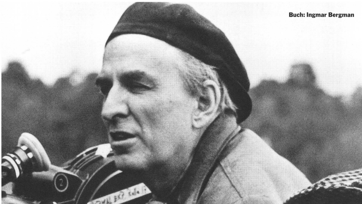
Buch: Ingmar Bergman

wie es sich denn mit dem Schatten Bergmans im Schlepptau leben lasse. Den Produzenten, neun europäischen Fernsehstationen unter Federführung des schwedischen Fernsehens, sind solche Sorgen einerlei. Sie haben die Kombination Bergman/August absichtlich gesucht, denn sie garantiert den Erfolg. Mit 70 Millionen Kronen oder umgerechnet etwa 18 Millionen Franken ist es der teuerste Film in der schwedischen Filmgeschichte geworden. Er wurde in zwei Versionen hergestellt, einmal als Vierteiler (viermal neunzig Minuten) fürs Fernsehen, der in Skandinavien vergangene Weihnachten gezeigt wurde, dann als zweieinhalbstündige Kinoversion, die auf dem Filmfestival von Cannes im Mai Premiere haben wird. Dort hat sie gute Chancen, einen Preis zu gewinnen. Kurz danach kommt der Film auch in die Kinos, während die Fernsehfassung noch auf sich warten lassen wird.