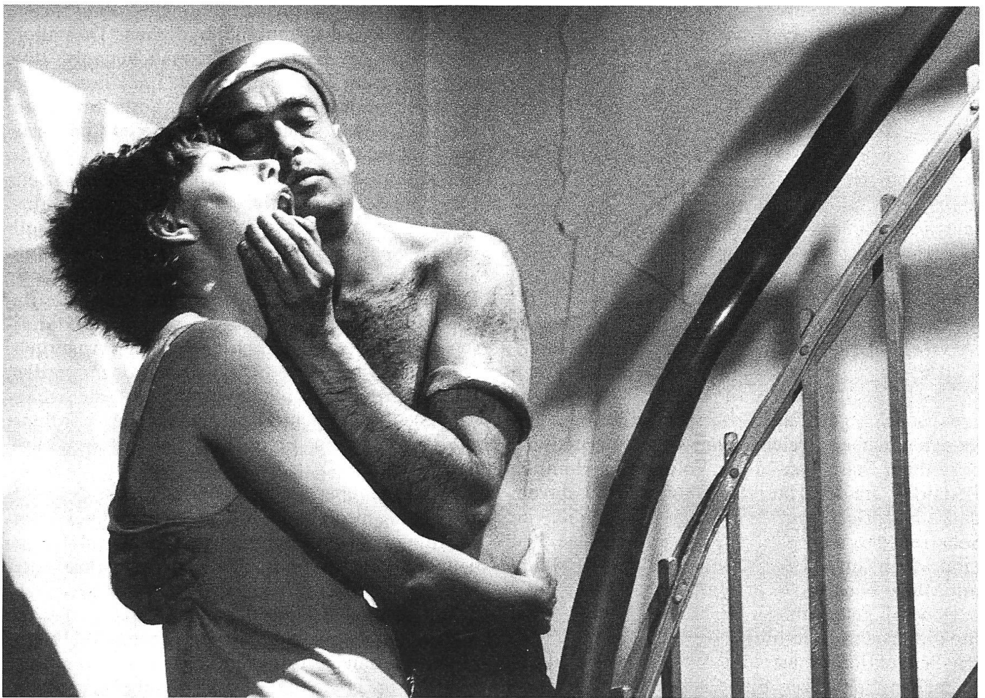
Als Debütfilm wurde Matthias Zschokkes «Edvige Scimitt», irgendwo zwischen Kluge und Syberberg, vor allem in Deutschland begeistert aufgenommen.

Wende – ob positiv oder negativ gewertet – erfasste Mitte der achtziger Jahre tendenziell auch Inhalt und Form der Schweizer Filme.