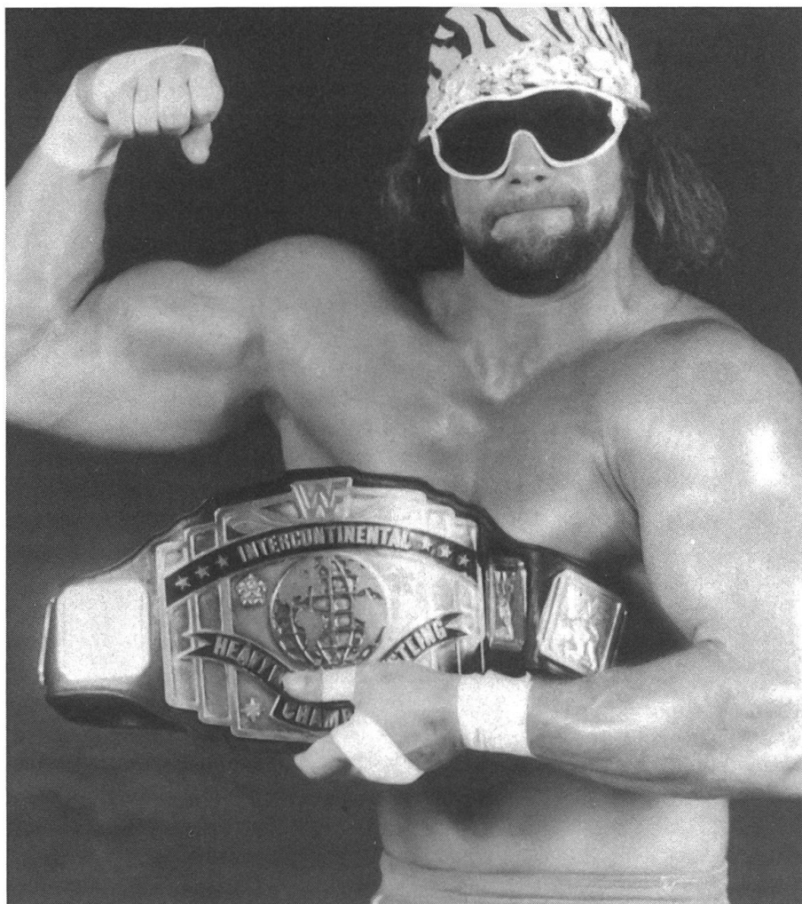
«Wrestling» als Showkampf zwischen einem guten und einem bösen Ringer. Hulk Hogan, Randy «Macho Man» Savage.

sind beliebig austauschbar. Ob nun «Heartline», «UK Despatch» oder «Love in the Morning» – es werden ständig dieselben Clips wiederholt. Besonders augenfällig wird das bei den an Hitlisten orientierten Sendungen. «Coca Cola Eurocharts Top 50» (was für ein Titel!), «UK Top 40» oder «Countdown», die einzige Variation ist jeweils die Reihenfolge der Clips.