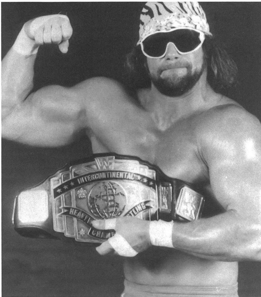
«Wrestling» als Showkampf zwischen einem guten und einem bösen Ringer. Hulk Hogan, Randy «Macho Man» Savage.

sind beliebig austauschbar. Ob nun «Heartline», «UK Despatch» oder «Love in the Morning» – es werden ständig dieselben Clips wiederholt. Besonders augenfällig wird das bei den an Hitlisten orientierten Sendungen. «Coca Cola Eurocharts Top 50» (was für ein Titel!), «UK Top 40» oder «Countdown», die einzige Variation ist jeweils die Reihenfolge der Clips.