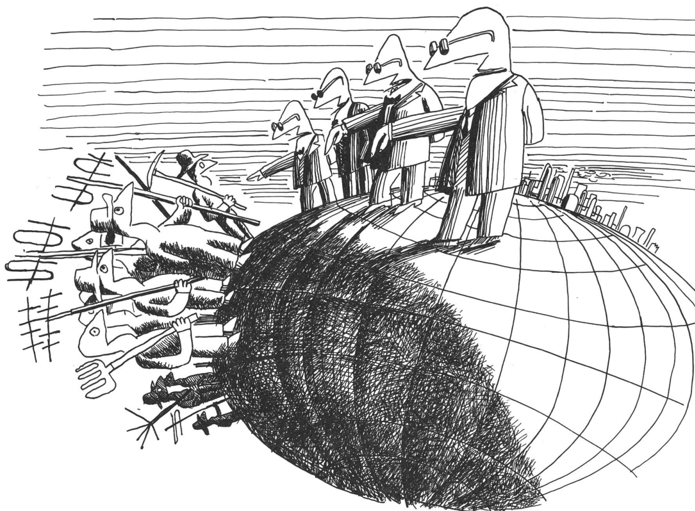
Aus «medium» 2/87, Rademacher

An dieser unfeinen Politik mit dem Geldhahnen hat auch die Schweiz ihren betrüblichen Anteil, indem sie sich – unbekümmert um alle Neutralität – ganz offen ins westliche Lager schlug. Das Hauptargument für diese entschiedene Parteinahme: Die neue Welt-Informations- und Kommunikationsordnung sei mit den Grundsätzen unserer verfassungsmässig verankerten Pressefreiheit nicht zu vereinbaren. Es ist hier nicht der Ort, darüber nachzusinnen, weshalb sich diese Pressefreiheit in der Schweiz in den letzten Jahren immer mehr zu einer