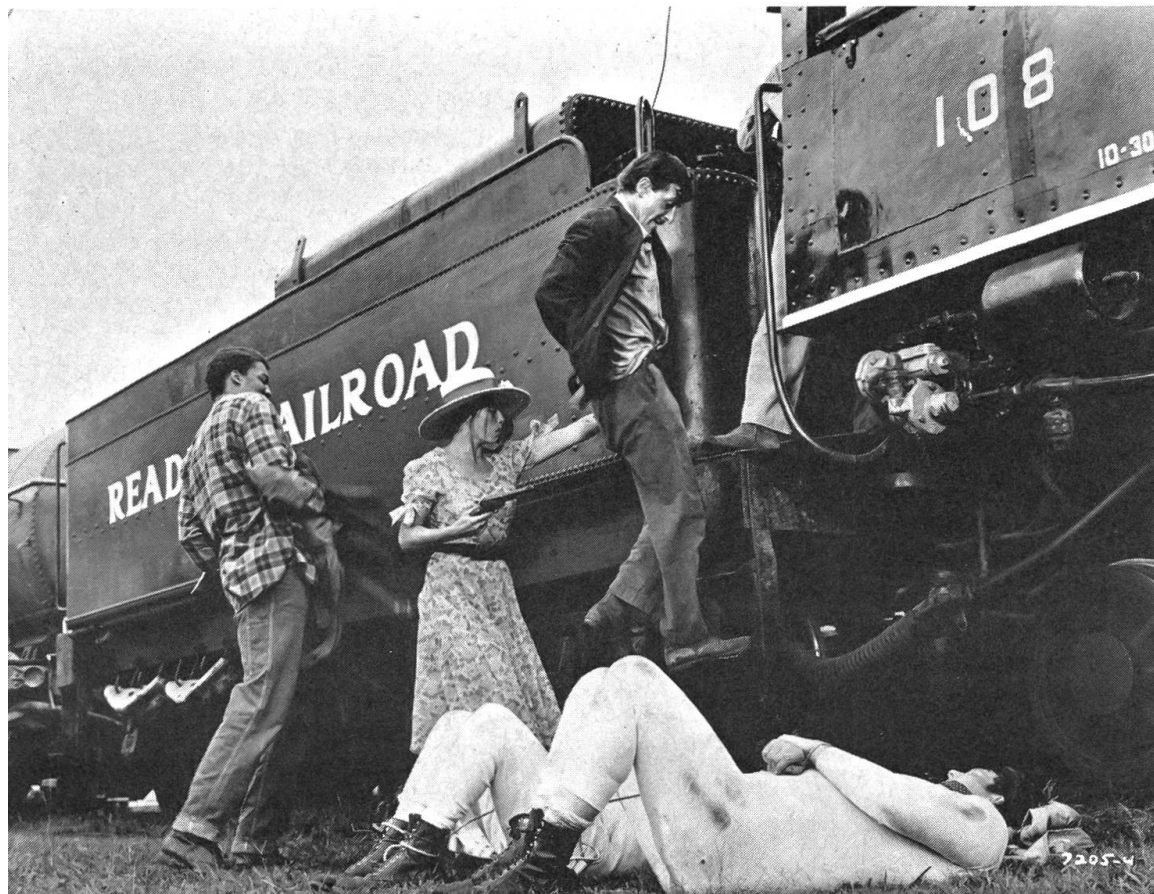
Freigefilmt mit «Boxcar Bertha» (1972).

Die Bilder – hier wie dort von Michael Chapman – tun das ohnehin: Travis Bickle in seinem regennassen «yellow cab», auf dem sich die Grossstadtlichter vielfältig spiegeln. Im Gewirr des nächtlichen Verkehrs, vorbei an dampfenden Gullys, an zischenden Hydranten, die Nachtgesellschaft im Visier. Die Irrealität der Szene wird skandiert durch die Saxophon-Staccati des Komponisten Bernard Herrmann. Mittel, die stilbildend wurden für «New York, New