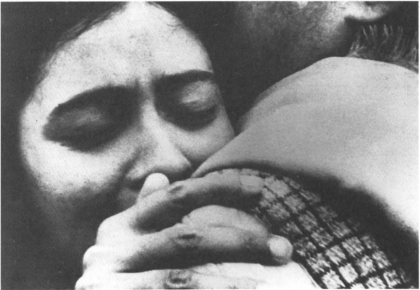
Nitas Gesicht als Seelenlandschaft: Supriya Choudhury in «Meghe Dhaka Tara» (Der hinter Wolken verborgene Stern).

auch durchmisst. Gekoppelt ist die Bildebene mit einer adäquaten Tonspur, die vor allem in der Musik, die Stimmungen weiterträgt und verdichtet, die Sinn-Bilder stützt.