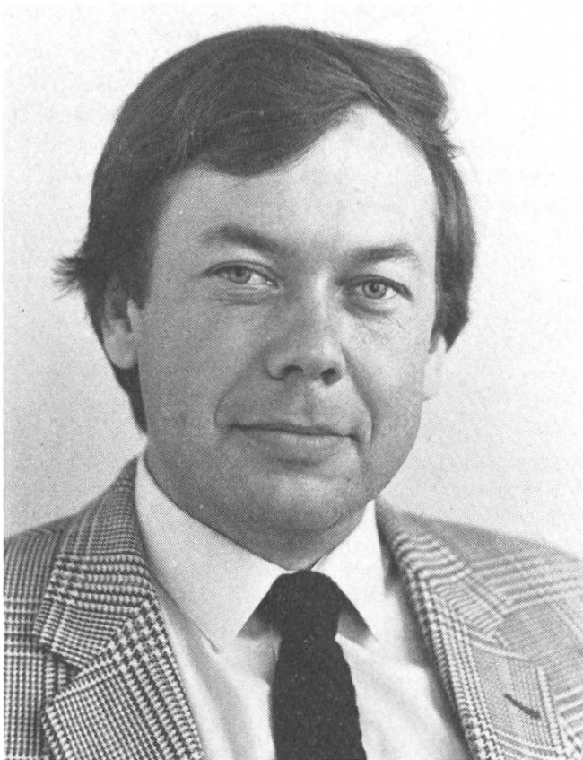
Kassensturz-Chef Beat Hurni.

Wertvorstellungen. Das hat nichts mit fragwürdigem Journalismus zum «Zwecke einer marktgerechten Prangertheatralik, vorgetragen im süffisanten Ton des pharisäischen Besserwissers» zu tun, wie in der «Neuen Zürcher Zeitung» geschrieben wurde – sehr emotionell notabene, aber leider ohne Fakten-Rückhalt.