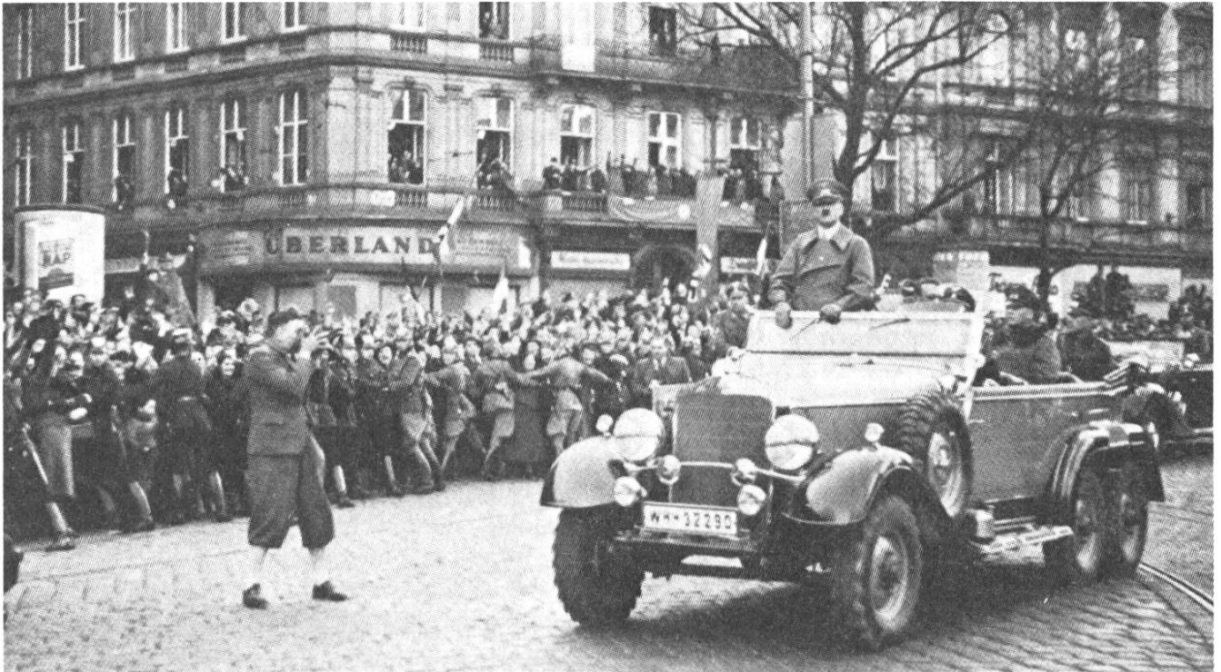
Nach dem «Anschluss» Österreichs 1938: Hitler auf dem Ring in Wien.

stellt sich hier der Anspruch an eine so ehrgeizige TV-Reihe, ob sie mit ihren Darstellungsmitteln der älteren und jungen Generation bewusst werden lässt, was mit uns selber und der Gesellschaft anders werden muss, damit sich die faschistische Barbarei nicht wiederholt. Trauerarbeit bedeutet für die Autoren und das Publikum Arbeit an der sozialen Wirklichkeit und der Wahrnehmung innerer und äusserer Realität als Voraussetzung.