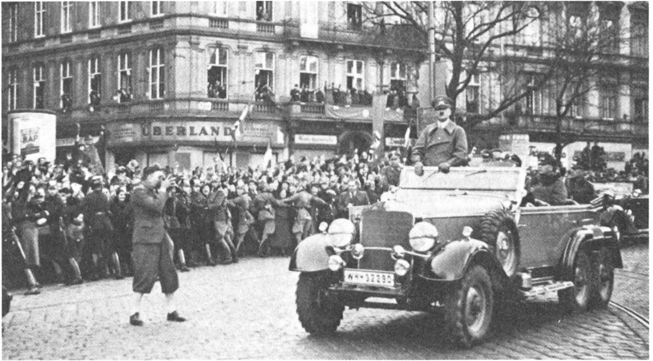
Nach dem «Anschluss» Österreichs 1938: Hitler auf dem Ring in Wien.

stellt sich hier der Anspruch an eine so ehrgeizige TV-Reihe, ob sie mit ihren Darstellungsmitteln der älteren und jungen Generation bewusst werden lässt, was mit uns selber und der Gesellschaft anders werden muss, damit sich die faschistische Barbarei nicht wiederholt. Trauerarbeit bedeutet für die Autoren und das Publikum Arbeit an der sozialen Wirklichkeit und der Wahrnehmung innerer und äusserer Realität als Voraussetzung.