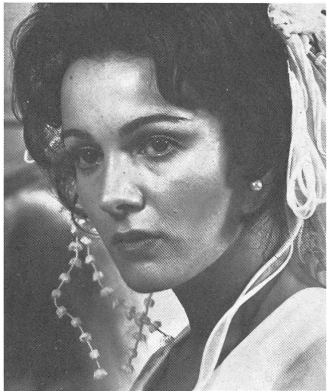
Zwei Gesichter Boliviens.

scher Indios (Gesamteinwohnerzahl fünf Millionen), die bis 1952 fast wie Ausländer im eigenen Land behandelt wurden. Ihnen will der Sprung in die Welt der weissen Criollos europäischer Abstammung, die seit anderthalb Jahrhunderten das Land, seine Wirtschaft und seine Institutionen beherrschen, auch heute nicht gelingen.