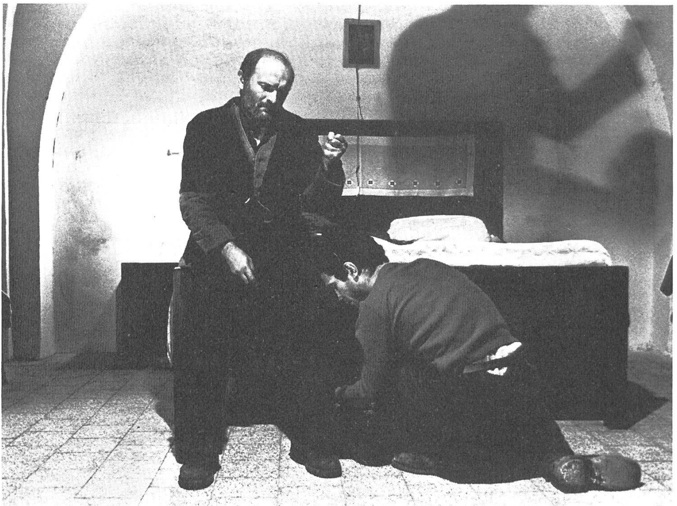
Aus «Padre Padrone» von Paolo und Vittorio Taviani