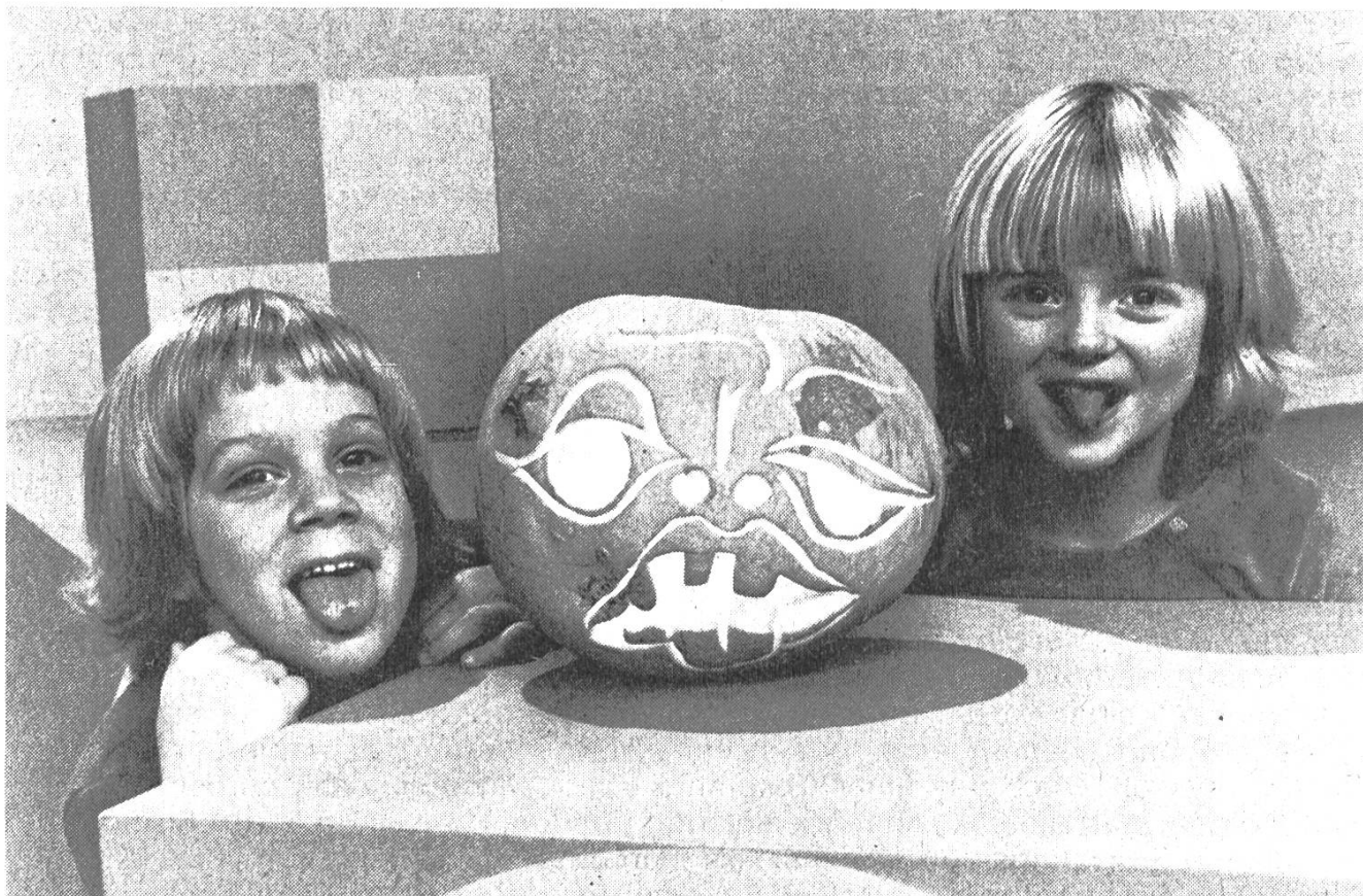
Aus der Sendung für Kinder «Das Spielhaus» vom 13. September 1977: Esther und Titus

einer grundsätzlich anderen Lage befinden: Auch sie sind Erwachsene und erheben den Anspruch, aufgrund ihrer Erfahrung und ihrer theoretischen Einsichten kindliche Bedürfnisse ab- und erklären zu können. Sie führen damit die zumindest seit der Erstauflage des Struwwelpeters (um 1850) gültige Tradition weiter, erzieherische, d. h. weltanschauliche Werte über Massenkommunikationsmittel zu verbreiten. Wie Kinder- und Bilderbücher, Spiele und Spielsachen ist auch diese Sendung ein Gefäß, in welches Überzeugungen und Ansichten aus der Erwachsenenwelt hineingegossen werden können. Und ähnlich wie in unserer Schule, in der Familie und in anderen erzieherischen Situationen, geht es auch hier darum, die Welt der Erwachsenen mit derjenigen der Kinder zu vermitteln , beziehungsweise letztere auf das Leben später vorzubereiten. Dies wurde bei allen drei Ausgaben des «Spielhauses» ersichtlich, die ich mir angeschaut habe.