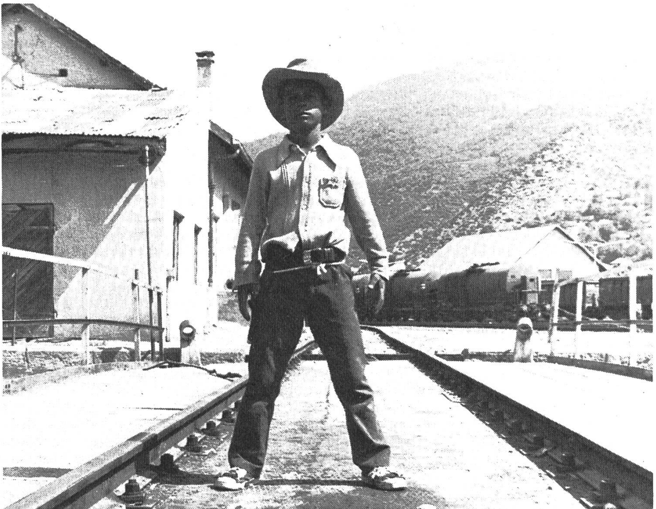
Halbwüchsige in einem iranischen Dorf imitieren die Erwachsenenwelt des Fernsehens: «Wooden Pistols» von Shapur Gharib (Iran)

Schon ein halbes Jahr nach der Eröffnung des Kinos der Brüder Lumière in Paris gab es im Sommer 1896 die ersten Filmvorführungen in Schweden. Im Sommer 1897 kurbelte der französische Kameramann Promio die ersten Filmaufnahmen im Nordland. Es dauerte dann noch fast zwei Jahrzehnte, bis der schwedische Film Aufmerksamkeit fand. Das Grundproblem dieses Filmlandes bis heute: Es findet nur ab und zu Auslandsinteresse, welches dazu noch oberflächlich ist. Schweden aber braucht das Auslandsinteresse, kann nur so die Filmmacher im Lande behalten, überhaupt