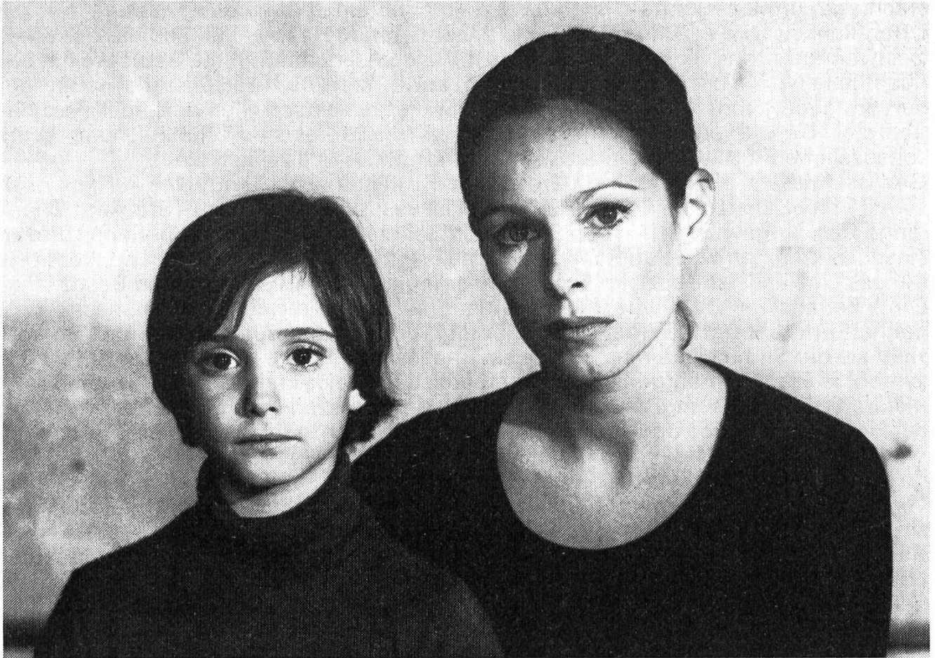
Kinderaugen durchdringen die erstarrte spanische Gesellschaft, in der sich selbst der Tod überlebt: Ana Torrent und Geraldine Chaplin in Carlos Sauras «Cria cuervos...»

entfernt vom Klischeebild einer paradiesischen Kindheit, ein eigenes Universum geschaffen hat, das mehr von nächtlichen Schrecken, unbekannten Ängsten und dem Gefühl von Einsamkeit und Inkommunikabilität geprägt ist als von Lebensfreude und kindlichem Erlebnishunger. In Anas Reich finden nur jene Platz, die dem entsprechen, was sie von ihnen erwartet. Sie fühlt sich als Herrin über Leben und Tod und sie ist unfähig, sich in der Welt der Erwachsenen zu integrieren. Und es ist vor allem der Tod , der das erstickende, ebenfalls in die Gewalt ausbrechende Klima dieser Familie prägt, die Saura als Metapher für die spanische Gesellschaft unter Franco verstanden wissen will. Sauras stellenweise verschlüsselter Film zeichnet sich durch eine ungewöhnlich bewegliche, stimmungsdichte Inszenierung aus. Am eindrucksvollsten jedoch waren für mich die tiefschwarzen, unergründlichen, wissenden Kinderaugen der kleinen Hauptdarstellerin Ana Torrent, die ohne weiteres den Preis als beste Schauspielerin verdient hätte.