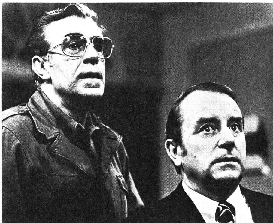
«Besuch auf einem kleinen Planeten» von Gore Vidal mit Peter Pasetti und Klaus Schwarzkopf

epd. Acht grössere Universitäten in Grossbritannien werden in Kürze über selbstbetriebene Rundfunksender verfügen, die nicht nur Vorlesungen und Diskussionen übertragen, sondern auch über studentische Belange wie Verbandswahlen, politische Aktivitäten und Sit-ins informieren sollen. An den Universitäten in York, Essex, Kent und Brunel wurden derartige Stationen bereits eingerichtet, die Studenten in Warwick, Lancaster, Surrey und Strathclyde wollen so bald wie möglich nachziehen. Die Kosten, die sich auf 300 bis 600 Pfund jährlich belaufen, werden von den Studentenverbänden getragen. Auf Band aufgezeichnete Interviews mit Studentenfürhern, Rektoren und Professoren sollen zwischen den einzelnen Universitäten ausgetauscht werden. Daneben ist geplant, Teach-ins und Diskussionen per Telefon zu übertragen. Die Gebühren für die Sendelizenzen, die vom