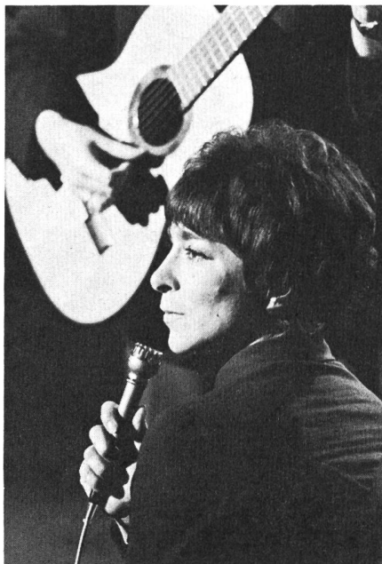
Hana Hegerova in einem Porträt des Deutschschweizer Fernsehens (15. Oktober, 22.30 Uhr)

Um ein gewisses Ordnungsprinzip in diese Vielfalt von Musikarten zu bringen und um arbeitstechnisch die verschiedenen Musikformen in den Griff zu bekommen, ist das ganze Sachgebiet in Sparten aufgeteilt: Symphonische Musik – Kammer-