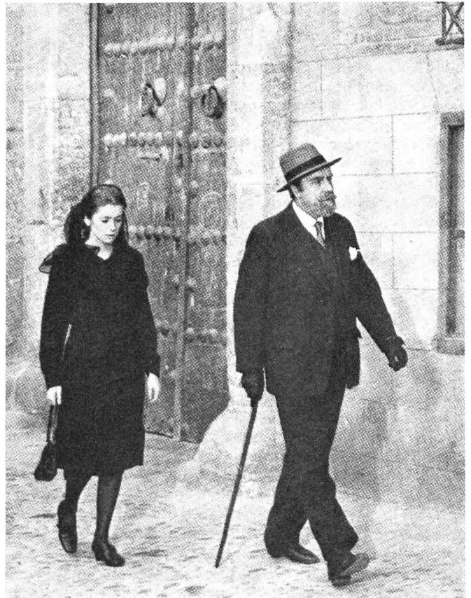
Die beiden Hauptfiguren im kritischen, in Cannes erstmals gezeigten Bunueelfilm «Tristana», Nichte und Onkel (Catherine Deneuve und Fernando Rey)

Und dann kam Bunuel mit «Tristana», jedoch ausserhalb der Konkurrenz, und zwar ganz auf seinen ausdrücklichen Wunsch. Nach einem etwas enttäuschend-melodramati-