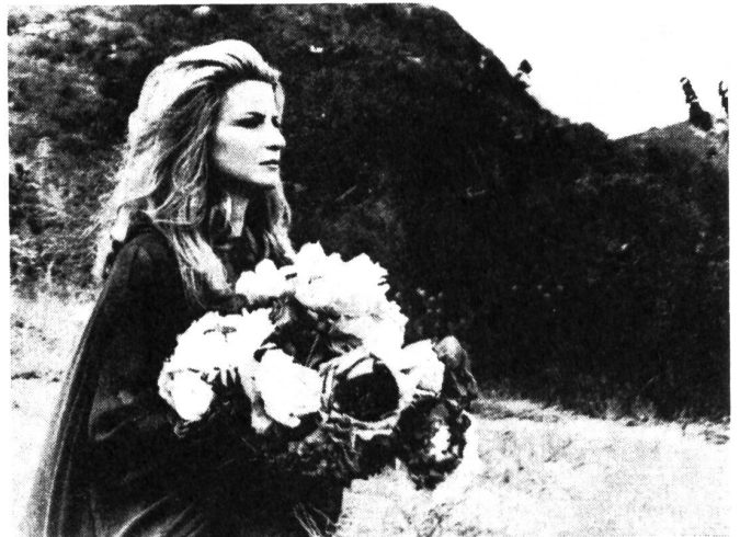
Poesie als Katalysator der Hellsichtigkeit in Glauber Rochas kraftvollem Film «Antonio das Mortes».