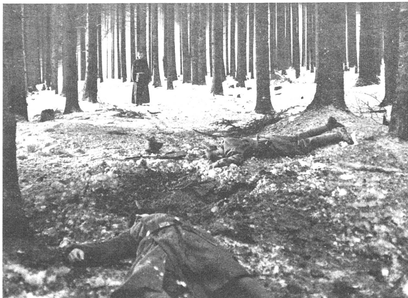
In dem tschechischen Film "Die Orgel", der in Locarno einen zweiten Preis erhielt, muss ein polnischer Flüchtling die Not geistiger und materieller Verfolgung erleben.