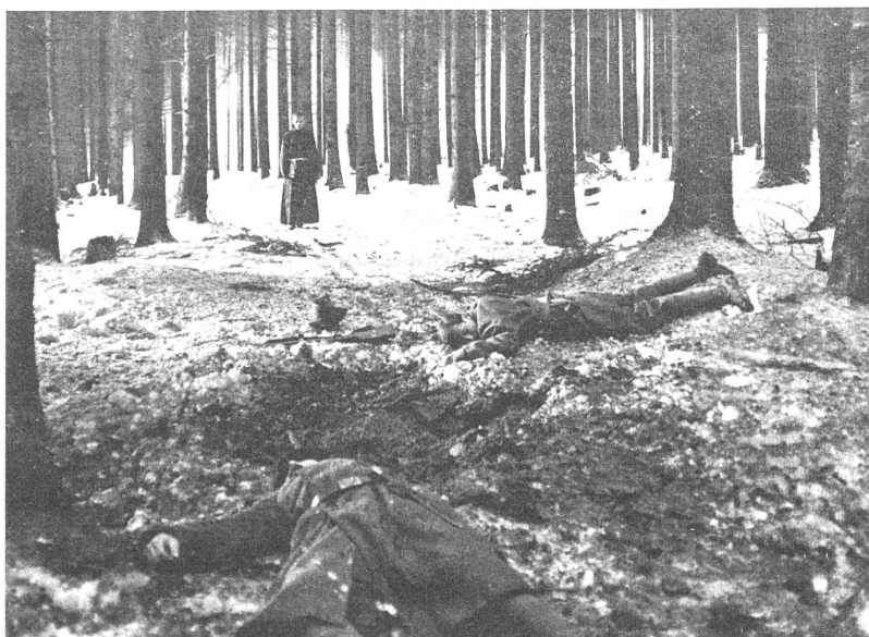
In dem tschechischen Film "Die Orgel", der in Locarno einen zweiten Preis erhielt, muss ein polnischer Flüchtling die Not geistiger und materieller Verfolgung erleben.