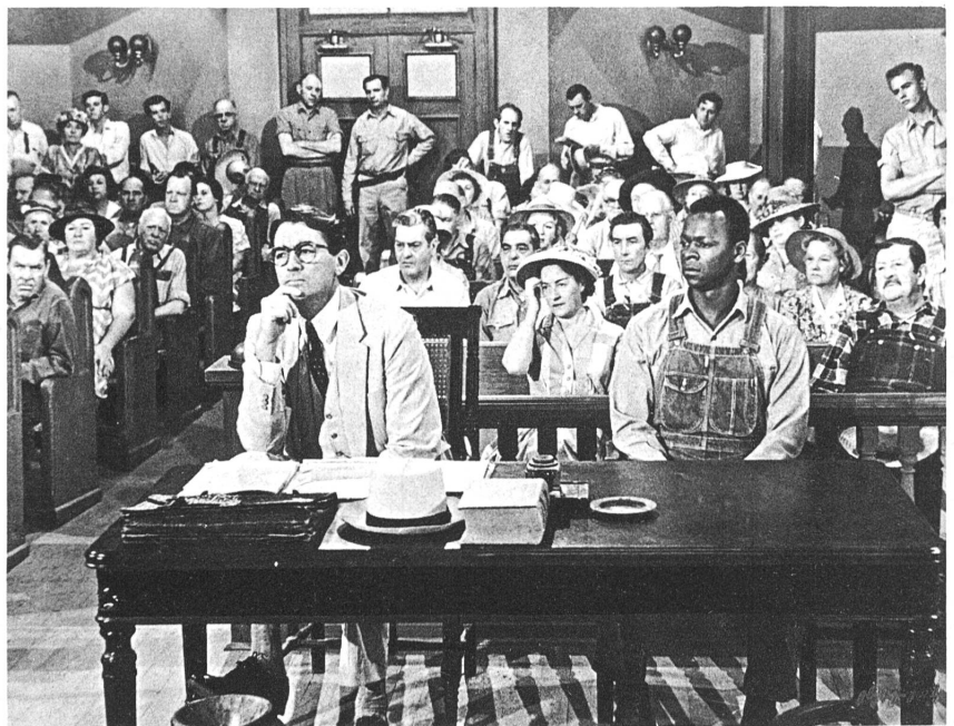
Die Gerichtsverhandlung gegen einen zu Unrecht beschuldigten, von Peck verteidigten Neger, bringt ihm Triumph und Niederlage zugleich.

ms. Das Thema des Streiks ist bis heute im Film nur selten be-