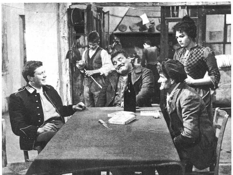
Echte Menschen aus der Zeit der Gründung von Gewerkschaften zeigt der Film "Die Genossen".

Die Geschichte erzählt den Verfall einer Ehe, die während zweier Jahre in einem Glück gehaust hatte, das so selbstverständlich war, dass es gar nicht auffiel. Der Mann, Javal, liebt seine Frau und be-