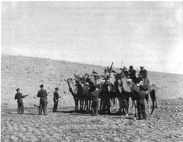
Ertappte, orientalische Rauschgiftschmuggler in dem ausgezeichneten Dokumentarfilm über Israel "Paradies und Feuerofen".

nacht zeigt. In grossartigen Einstellungen fängt dieser Dokumentarfilm das Nachtleben Londons ein, von der Riesenschlange vor den Lichtspieltheatern bis zu den billigen Strassenmädchen, die um Mitternacht noch keinen Freier gefunden haben. Besonders packend sind die Grossaufnahmen vieler, einzelner Gesichter, die für einen Augenblick aus der Masse auftauchen, ein eindrückliches Menschenporträt abgeben und dann wieder im Gewimmel der Acht-Millionen-Stadt verschwinden. Noch nie haben wir so wahr die Atmosphäre eines Spielsalons oder den gierigen Ausdruck eines spielenden "Teddyboys" geschildert gesehen. Dieser Film wurde 1956 gedreht und gehört zu den wenigen Streifen in unserer Zeit, die ganz auf das gesprochene Wort verzichten und allein durch das Bild erzählen - ein Vorbild für alle jene Filmschaffenden, denen an einer ernsthaften und wahrheitsgetreuen Schilderung irgend eines "Milieus" gelegen ist.