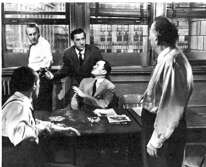
Mit grösster Erbitterung wird im Geschworenenzimmer im Film "Die 12 Geschworenen" um die Wahrheit in einem Mordfall gerungen.

Aber Nr. 8 lässt sich nicht so Hals über Kopf überreden, und da das amerikanische Gesetz Einstimmigkeit für den Entscheid verlangt, müssen ihn die Andern zu überzeugen suchen. Damit hebt in dem langweiligen Geschworenenzimmer ein dramatisches Ringen an, wie es in der Filmgeschichte einmalig ist. Ein Geisteskampf-Thriller könnte man den Film benennen.