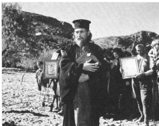
Oben: Flüchtlinge, von den Türken vertrieben und ausgeplündert, erscheinen mit ihrem Popen im Dorf und flehen um Aufnahme.