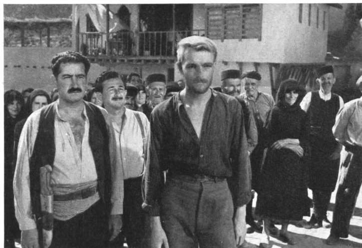
Links: Diese wird ihnen nicht gewährt, aber Passionsspieler helfen ihnen, die dadurch in Gegensatz zu den Dorfgewaltigen geraten und ihre biblischen Rollen im Leben spielen müssen.