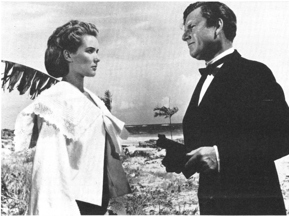
Ein heiterer Sommerfilm

AH. Bewunderungswürdig, wie die Engländer ihre Schwächen und Vorurteile als unerschöpfliche Quelle für Filme voll heiterer Selbstironie und lächelnder Menschlichkeit humorvoll auszu-beuten verstehen. Hier übernimmt ein Butler dank seiner überras- genden Fähigkeiten die Leitung