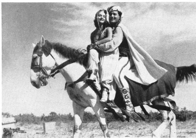
Das Paar aus dem ersten Fellini-Film, der den Romankitsch aufs Korn nimmt.

Die Geschichte ist in ihrer Erzählbarkeit (wie später dann alle Geschichten Fellinis) einfach. Ein Paar aus der Provinz kommt auf der Hochzeitsreise nach Rom, wo sie den Papst und den Vatikan besuchen wollen und von den Verwandten umhergeführt werden sollen. Aber kaum angekommen, entslüpft die junge Frau dem