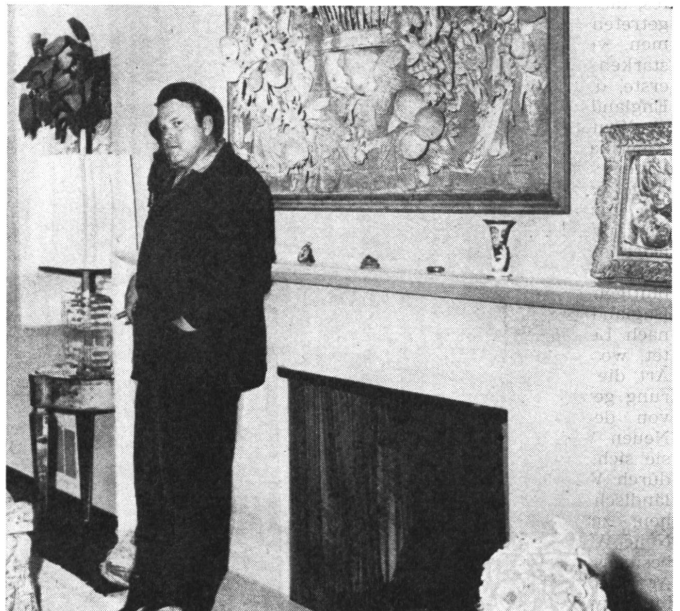
Orson Welles, nach Amerika zurückgekehrt, am Kamin seines neuen Hauses in Hollywood, das er einst unter Verwünschungen verließ.

ZS. Seit acht Jahren hat Orson Welles geschwiegen. Der Wunder-Knabe des Films, der 1938 mit seiner berühmten Radio-Sendung über einen Einfall der Marsbewohner die amerikanische Bevölkerung in Schrecken versetzte, der mit seinem «Citizen Kane» die Filmindustrie erstaunte und selbst erfahrene Kritiker verblüffte, um dann auch als Schauspieler im «Dritten Mann» eine hervorragende Lei-