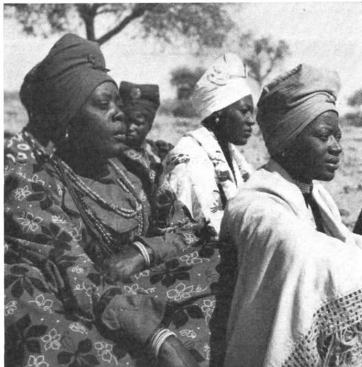
Herero-Frauen. Die Hereros sind ein stolzer Volksstamm, der früher blutige Aufstände organisierte.

FH. Wo steht die Mission in Afrika heute? Wie ist ihr Verhältnis zur Zivilisation, wie wirken sich die Streitfragen der Rassentrennung, des Nationalismus, der Industrialisierung usw. auf die schwarze Bevölkerung und die Missionsarbeit aus? In diesem ausgezeichnet aufgenommenen Farbfilm wird darüber ein großes Schaumaterial dokumentarisch vor uns ausgebreitet, ein kompaktes Bild afrikanischer Verhältnisse, das eine Fülle von Anregungen und Diskussionsstoffen übermittelt. Das Filmtempo entspricht nicht nur der afrikanischen Gemächlichkeit, welche Eile als Unhöflichkeit bewertet, sondern ermöglicht