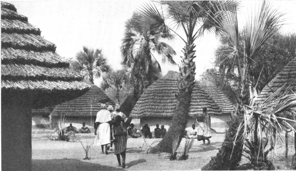
Eine Spital-Anlage in Südwest-Afrika. Hier arbeiten protestantische Schwestern.