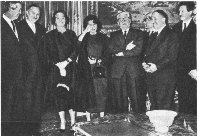
Die Preisträger des «Silberbandes» beim italienischen Staatspräsidenten. Links John Huston, in der Mitte Anna Magnani, neben ihr Staatspräsident Gronchi (mit Brille), neben diesem Zavattini, ganz rechts Germi.

ZS. Alljährlich werden in Italien von den Filmkritikern die «Nastri d'argento», die Silberbänder für die besten Jahresleistungen auf dem Filmgebiete verteilt. Es sind die höchsten Filmauszeichnungen, welche das Land kennt, eifersüchtig umworben und festlich verteilt. Dieses Jahr war man auf die Entscheide besonders gespannt, denn die italienische Filmproduktion hat bekanntlich ein schlimmes Jahr mit Konkursen und Mißerfolgen hinter sich, und die Auswahl an guten Filmen war klein. Die Entscheide sind denn auch sehr rasch gefallen,