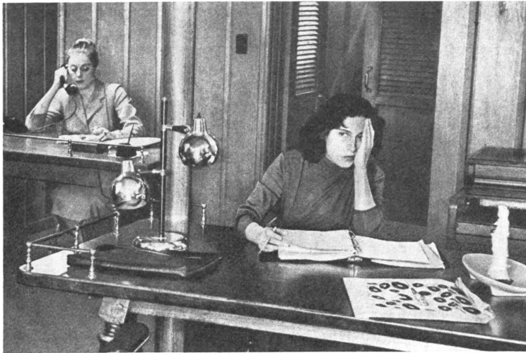
Anna Magnani in ihrem neuen Heim in Hollywood, das vorher Marlene Dietrich und später Grace Kelly gehörte. Links ihre Englisch-Lehrerin. Sie erklärte, sich in Amerika wie in einem «heißen Kassenschrank» zu fühlen.