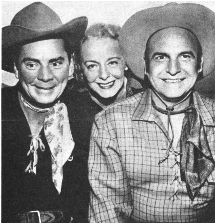
Jackie Cogan (rechts), einst weltbekannt als Chaplins «Kid», spielt heute nur noch in Fernseh-Filmen. Links Russel Hayden.