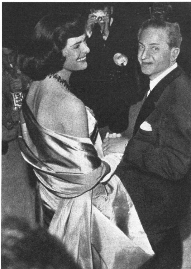
Jules Dassin («Rififi»), der den sehr bemerkenswerten Film «Celui qui doit mourir» schuf mit der griechischen Schauspielerin Melina Mercouri, die darin die Hauptrolle spielt, in Cannes.

Katie Johnson, die unvergeßliche alte Dame aus den «Ladykillers», starb im Alter von 78 Jahren. 1955 mit der Auszeichnung «beste Schauspielerin Englands» bedacht, konnte sie auf 61 Jahre Bühnen- und Filmtätigkeit zurückblicken.