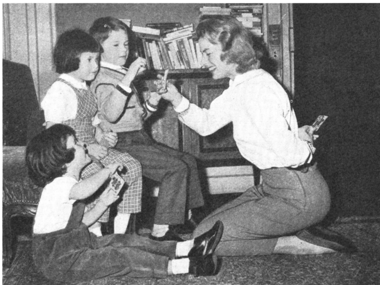
Ingrid Bergmann, zurück von ihrer erfolgreichen Filmarbeit, spielt mit ihren Kindern.