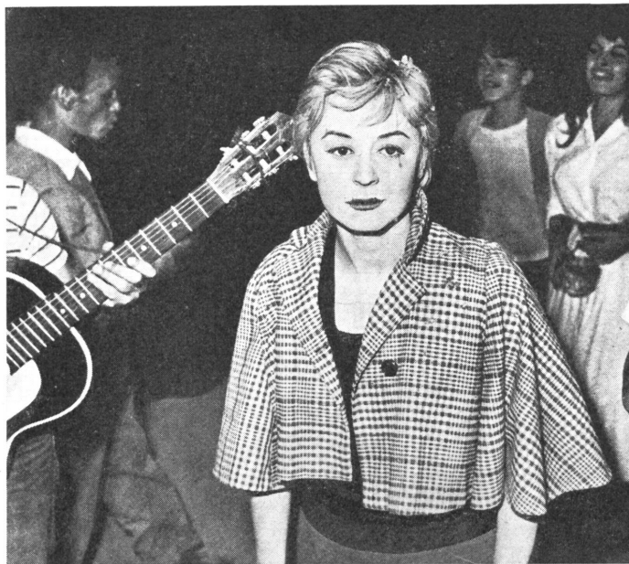
Stroheim, dessen Wirken als Schauspieler und Regisseur der Filmgeschichte angehört, erhält in Paris das Kreuz der Ehrenlegion. «Die Nächte der Cabiria», Fellinis neuer Film mit Giulietta Masina, ist fertiggestellt. Trostlos kehrt hier Cabiria am Ende vieler Enttäuschungen wieder in ihr gewohntes Leben zurück.