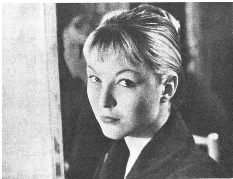
Marina Vlady, Idol und Vorbild vieler junger Mädchen von heute, ist zum Theater gegangen, wobei sie ihr Aussehen stark veränderte.