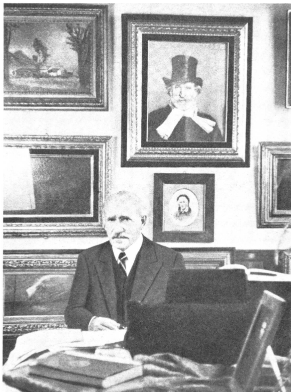
Toscanini kurz vor seinem Tode unter dem Bild des von ihm neben Beethoven und Wagner vor allem verehrten Verdi.