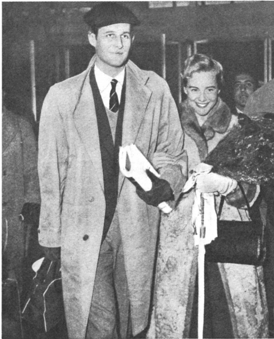
Maria Schell trifft mit ihrem Bräutigam in Rom ein, um die Arbeit an einem Dostojewski-Film «Weiße Nächte» zu beginnen. Regie führt L. Visconti. Es war ein alter Wunsch von ihr, in Italien spielen zu können.