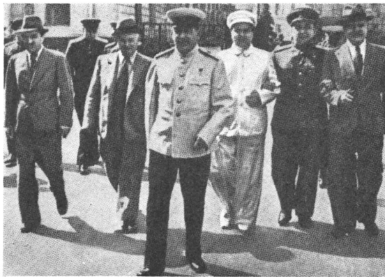
Stalin, dem 20 Jahre wildeste Despotie und Mord von Chruschtschew und Genossen vorgeworfen werden, 1945 mit seinen engsten Mitarbeitern (von links nach rechts): Molotow, Chruschtschew, Malenkow, Beria und Molotow.