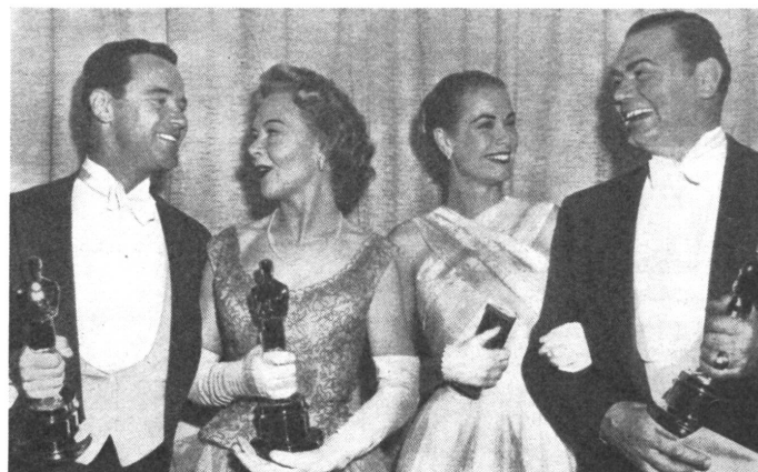
Oscars 1956 (von rechts nach links): Borgnine («Marty»), Grace Kelly, welche die Verteilung vornahm, Jo van Fleet («East of Eden»), Jack Lemmon («Mister Roberts»).