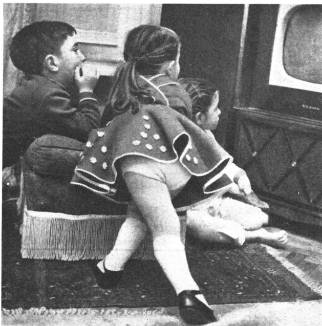
Filme jetzt auch für die Jüngsten, sogar ohne Zensur — aber im Fernsehen.