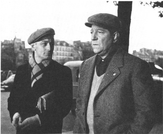
Jean Gabin im atmosphärischen Film «Pariser Luft», wofür er in Venedig eine Auszeichnung erhielt.

Was erzählt Carné? Nun, er erzählt die Geschichte eines alten Boxers, der sich in den Traum verhasst hat, als Lehrer ein großes Boxtalent auszubilden. Er begegnet diesem Talent, trainiert den Jungen, einen armen, verschuppten, in der Welt nicht gefragten, schüchternen und wehleidigen Burschen. Er schenkt ihm Freundschaft, er schenkt ihm