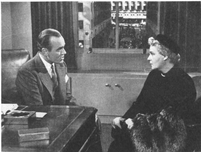
Shirley Booth, die hervorragende Schauspielerin, im Gespräch mit einem Anwalt im Film «Romanze ohne Morgen».

Der Film hat eine Melodie, die Melodie des schönen, reifen Gefühls. Sie wird nicht ausgespielt, sie wird nicht eingebettet ins Melodramatische. Von der Geschichte der Liebe, die hier erzählt wird und der man den unglücklichen deutschen Titel «Romanze ohne Morgen» gegeben hat, wird nur angerührt, wem das Halbgesagte, das im Nebenbei Ausgedrückte etwas zu sagen vermag. Eine Frau, Dancingsängerin, lernt einen Mann kennen. Sie findet, schon an die Schwelle des Alters ge-