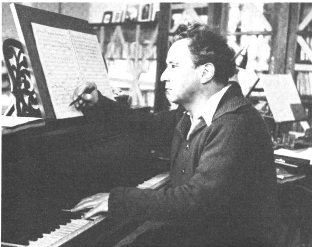
Arthur Honegger, der in Paris verstorbene Schweizer Komponist, bei der Arbeit, die ihm große Ehrungen einbrachte. Er schrieb auch protestantische Kirchenmusik.