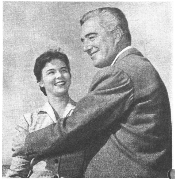
De Sica mit der endlich gefundenen Darstellerin seines neuen Films «Das Dach», einem Mädchen aus dem Volk, was zu Gegenmaßnahmen der Berufsschauspieler führte.