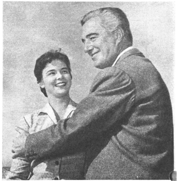
De Sica mit der endlich gefundenen Darstellerin seines neuen Films «Das Dach», einem Mädchen aus dem Volk, was zu Gegenmaßnahmen der Berufsschauspieler führte.