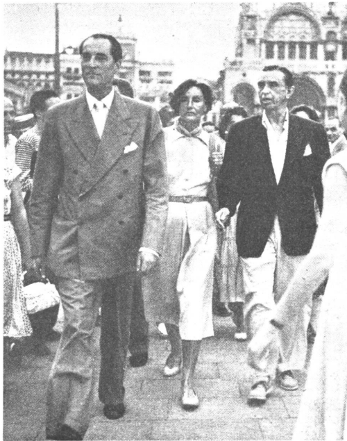
Greta Garbo, das Frauenidol einer Generation, hat sich seit Jahrzehnten erstmals anlässlich eines kurzen Besuches in Venedig widerspruchslos photographieren lassen.