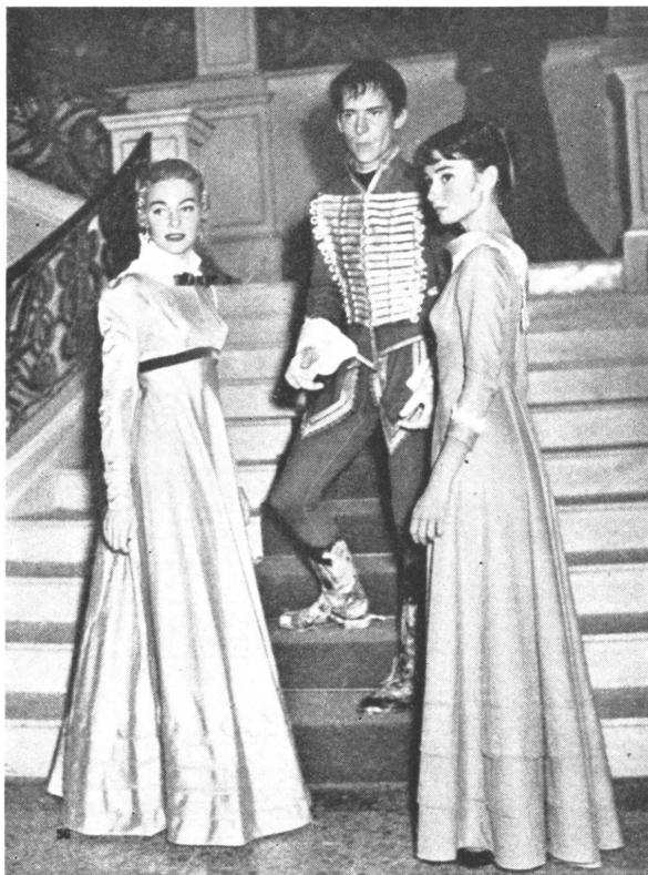
Audrey Hepburn als Natascha (rechts) zusammen mit Mae Britt in der gegenwärtig in Italien gedrehten Verfilmung von Tolstois «Krieg und Frieden». Auch die Russen bearbeiten den gleichen Stoff. Dem Maler Picasso ist die noch nie einem Maler widerfahrene Ehre zuteil geworden, daß zu seinen Lebzeiten im Louvre, wo die Werke der größten Künstler aller Zeiten hängen, eine Ausstellung seiner Bilder veranstaltet wurde. Hier kehrt er (Mitte) mit seinem Sohn von einem Sportanlaß zurück.