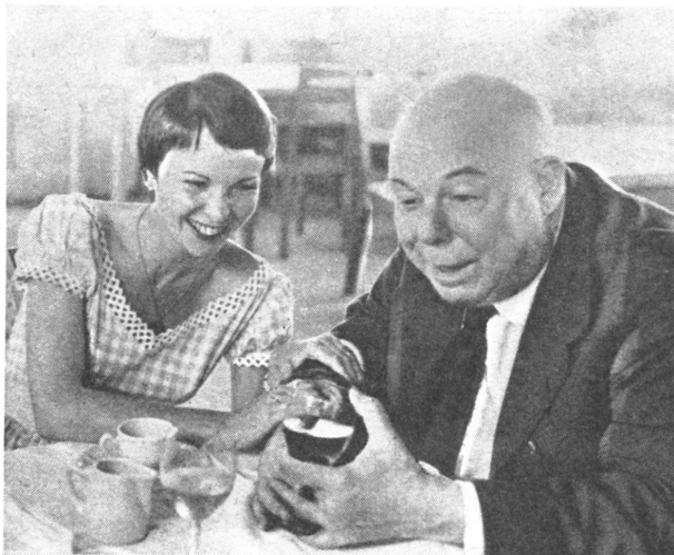
Regisseur Jean Renoir, Sohn des großen Malers und Schöpfer einer Anzahl bedeutender Filme, von denen einige in die Geschichte eingegangen sind, in Cannes nach der erfolgreichen Aufführung seines neuen Films «French Cancan» mit der Hauptdarstellerin Françoise Arnoul.

Evangelist Dr. Billy Graham, der in der englisch sprechenden Welt durchschlagende Erfolge erzielte, spricht heute im Hardturm-Stadion in Zürich. Hier begrüßt er Frau und Kind.