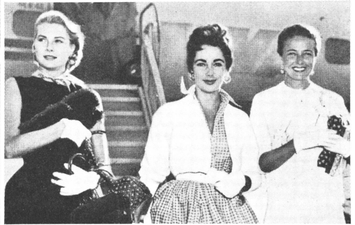
Grace Kelly, welche für ihre Rolle in dem neuen Film «The country girl» einen Oscar erhalten hat (links), auf einer Flugreise mit Elisabeth Taylor (Mitte).