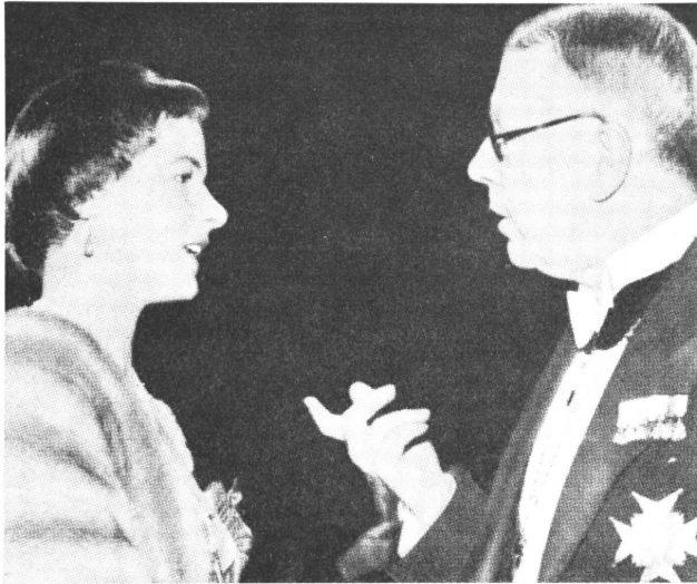
Ingrid Bergmann, die in ihrer Heimat sehr unfreundlich aufgenommen worden war und nie mehr nach Stockholm zurückkehren will, im Gespräch mit König Gustav von Schweden.