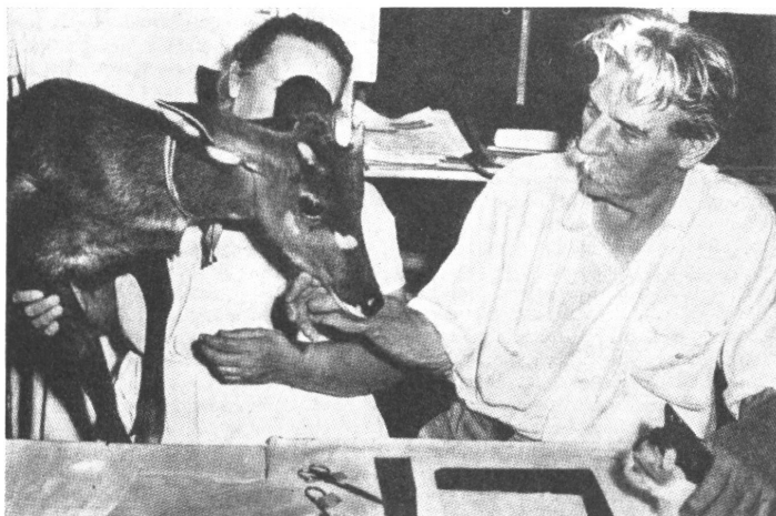
Neueste Aufnahme von Albert Schweitzer an der Arbeit in Lambarene.